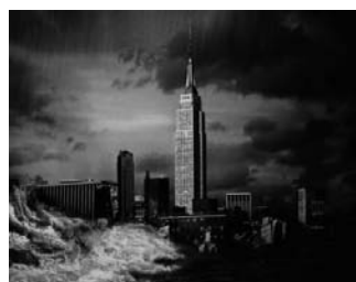
Слика 1. Ефекат Стаклене башије Слика 2. Претећи ефекти стаклене башије

Суочавајући се са умноженим и претећим последицама и нарушеним квалитетима животносрединског станишта 2 морамо се приупитати, имамо ли, и још колико нам преостаје времена за успоставу одрживог опстанка на богомданом овоземаљском станишту? Ово актуелно питање је важније од свих других питања. Ту се дакако ради о животном праву свих живих заједница, које претходи свим правима и демократским слободама (Ђеримовић 2007: 183-189). Наравно, то право на здраву животну средину представља и највећу обавезу људској врсти, јер је најодговорнија за умножавање еколошких проблема, али и за санирање неодрживог стања у које је кроз вишедеценијску неодговорност довела цео биодиверзитет 3 .